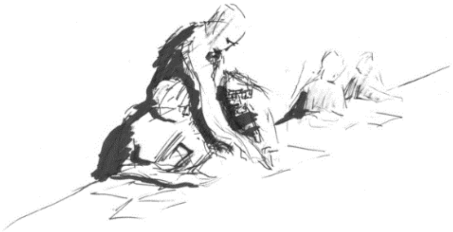
Abbildung 2: Kleingruppenarbeit in einer Gruppenübung