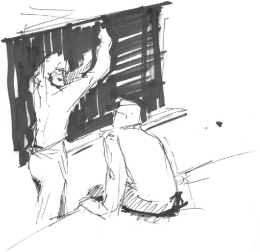
Abbildung 1: Mathematischer Vortrag